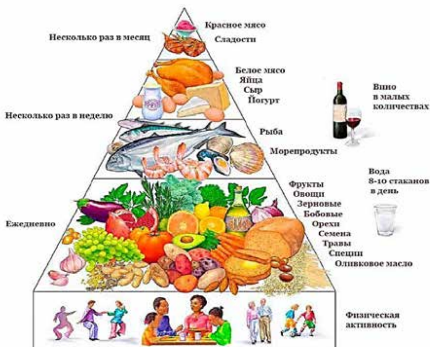
Рис. 2. Пирамида здорового питания, основанного на Средиземноморской диете