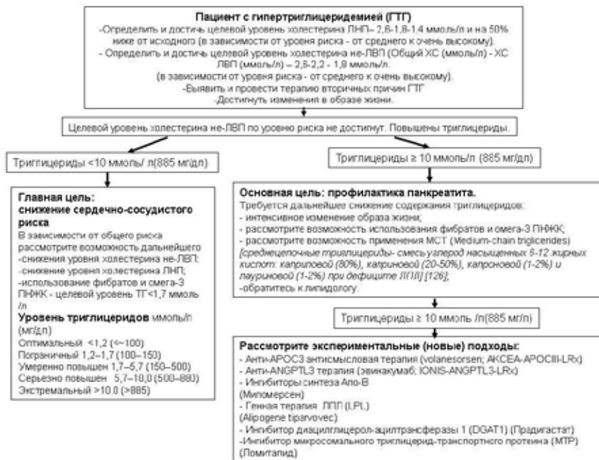
Рис. 4. Алгоритм действий при ГТГ в зависимости от уровня липидных факторов риска для снижения риска ССЗ и развития панкреатита