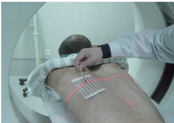
图 1 CT 下定位穿刺点(自制定位器)

1.2.1 “阶梯式”微创治疗 (1) 经皮穿刺置管引流术: CT 引导下定位穿刺点,采用定位纸或自制定位器(图 1)。采用 18G PTC 针穿刺脓腔,拔出针芯后,抽出脓液确定进入脓腔(图 2)。拔出穿刺针,顺导丝放置 12 ~ 16 F 猪尾管。定期行 CT 检查,明确腹膜后脓腔变化情况,并决定是否相应调整引流管位置。(2) 腹腔镜(肾镜)清创引流术: 手术时间通常选择穿刺置管引流术后 4 周,如患者穿刺引流效果不理想,病情无明显改善,手术时间可酌情提前。患者取左侧卧位或右侧卧位。沿窦道切开 2 ~ 3 cm 进入腹膜后间隙。循导丝逐渐扩张窦道(图 3)。经皮肾镜带有一个宽孔的工作通道置入腹膜后间隙,吸出脓液,逐块取出坏死病灶。如使用腹腔镜,扩张窦道后,置入 Trocar,充气建立操作空间,导入操作器械,抓取清除坏死组织(图 4)。留取部分脓液送细菌培养,留取部分坏死组织送病理检查。经切口于腹膜后脓腔内置入 36 号冲洗引流管,术后第 2 天开始持续冲洗。如一次无法清理彻底,或引流效果不理想,可 7 ~ 10 d 再次清创,直至引流液清亮。