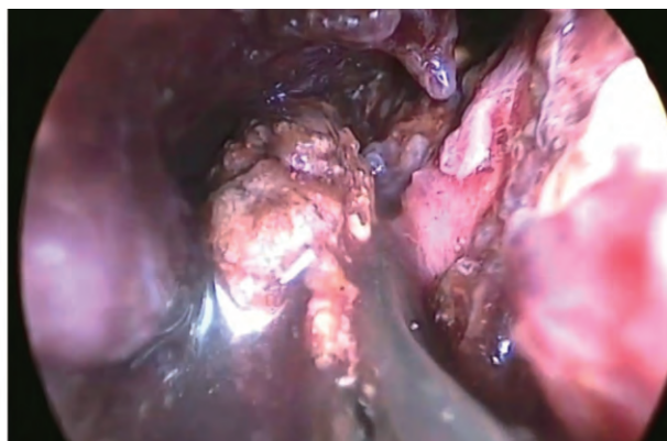
图 4 镜下抓取坏死组织