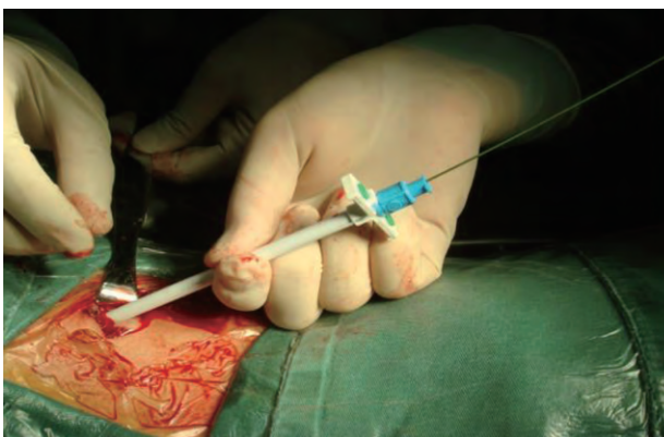
图 3 扩张窦道